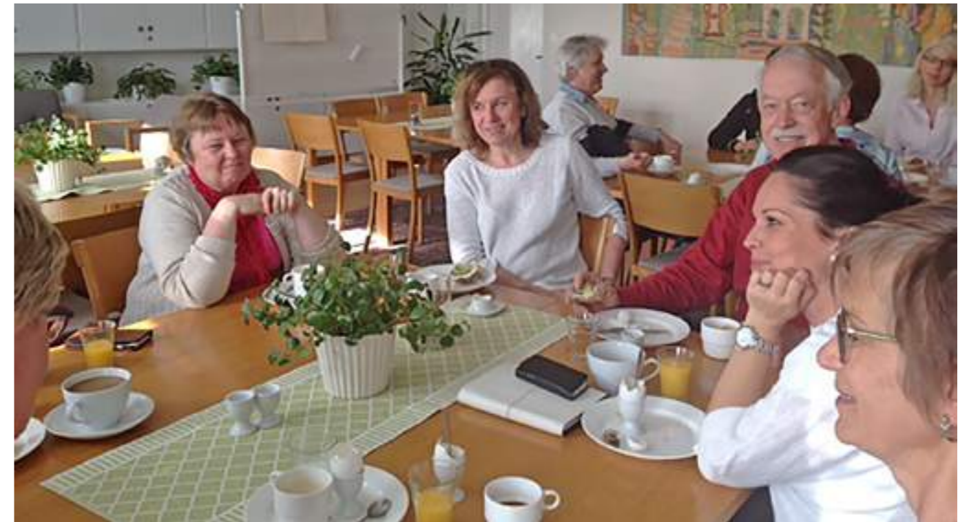
Frukostmöte i Hässelby Villastads kyrka.

När man pratar om företagande och nätverkande så är Svenska kyrkan kanske inte det första man tänker på. Därför blev jag så förvånad när jag hörde att Svenska kyrkan i Hässelby tar nätverksbyggande och skapa mötesplatser för företag på största allvar.